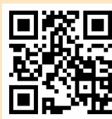
再生紙DIY參考影片 (片長約3分鐘)