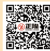
紙的再生製程 (片長約5分鐘)